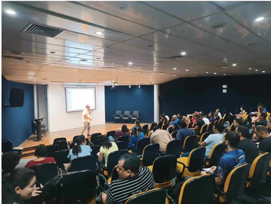
Foto 2 - palestra dinâmicas na educação volta ao antirracismo