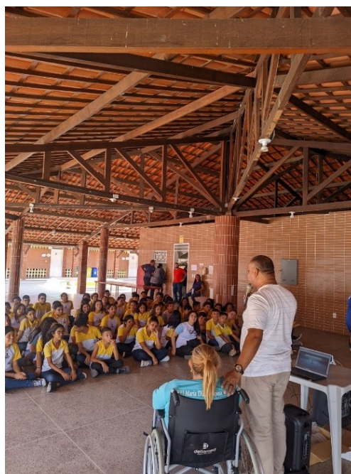
Foto 3 - Evento na escola com palestra sobre letramento racial

As ações desenvolvidas pela ETI Maria Dias Ibiapina evidenciam o compromisso institucional com a formação integral dos alunos, contemplando tanto o desenvolvimento acadêmico quanto a construção de sujeitos críticos, conscientes e sensíveis à diversidade. Essa experiência reforça o papel central da escola na promoção de uma educação antirracista, capaz de contribuir para a desconstrução de preconceitos e para a valorização da cultura afro-brasileira no contexto educacional.