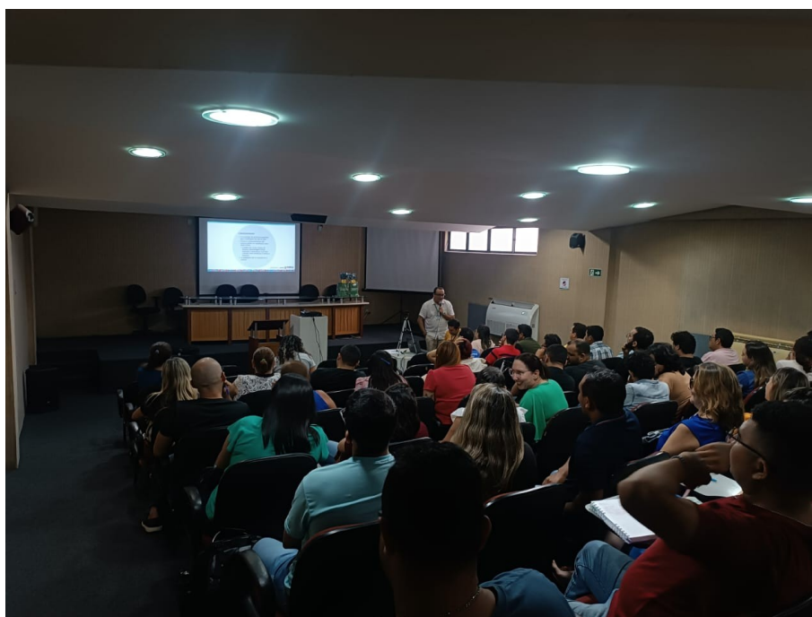
Foto 1- Formação dos professores de Geografia de Sobral

As formações ocorriam mensalmente, evidenciando um esforço contínuo de inserção da temática racial. As reuniões eram planejadas com abordagens dinâmicas, incluindo o uso de poesias, apresentações culturais e atividades voltadas ao letramento racial. Essas estratégias favoreciam a contextualização dos conteúdos e promoviam a sensibilização dos participantes, contribuindo para a construção de um ambiente propício ao diálogo e à reflexão crítica sobre as questões raciais no contexto educacional.