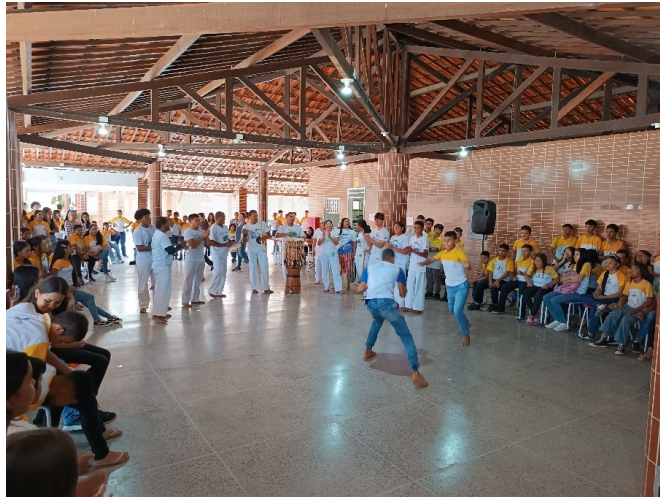
Foto 4- Roda de capoeira com participação dos alunos