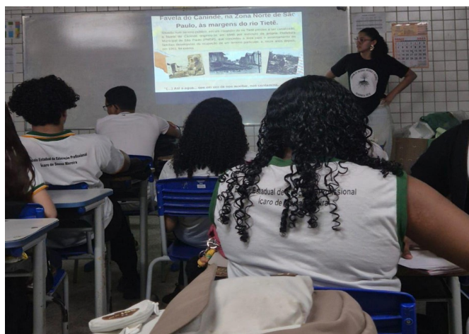
Figura 2. Interação com a turma do 2º ano do Curso técnico de Eventos

Compreendendo a necessidade de que o ensino de Geografia antirracista parta de uma abordagem contextualizada, buscamos articular os conteúdos escolares com as práticas sociais dos(as) estudantes. Através das interações com as turmas de 2º ano do Ensino Médio, dos cursos técnicos de Eventos e Administração, foi possível perceber que a atividade possibilitou um amplo debate em sala de aula e uma melhor compreensão da urbanização e de sua relação com o conceito de racismo ambiental.