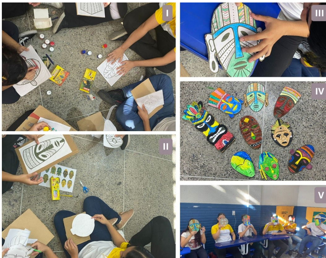
Figura 02: Práticas de Confecção de Máscaras Africanas

marginalizados. Isso evidencia o racismo institucional que se perpetua quando o Estado afirma valorizar a diversidade cultural sem fornecer os recursos, políticas públicas ou espaços adequados para que essas tradições sobrevivam de forma autônoma. A máscara africana, longe de ser um adorno folclórico, é símbolo de resistência histórica, uma afirmação da ancestralidade e da força dos povos africanos diante de estruturas que tentam silenciá-los.