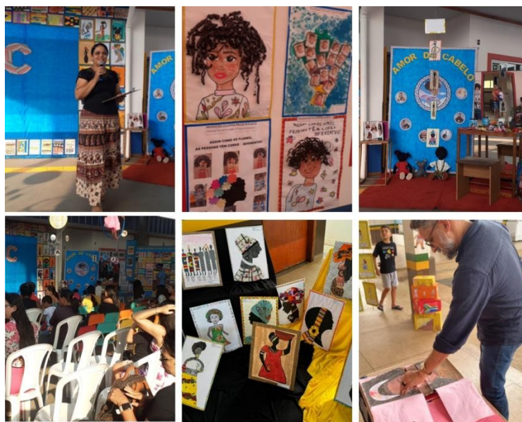
Imagem 1 – Mosaico de fotografias do projeto didático Canaã África e eu: a cultura e as cores de nossa história.