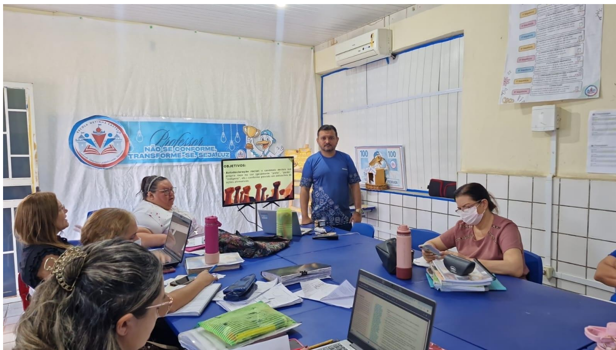
Figura 02 – Formação de Professores da escola Netinha Castelo

que os docentes passam a incorporar práticas antirracistas e interculturais em suas aulas, promovendo um ambiente escolar mais inclusivo, reflexivo e democrático.