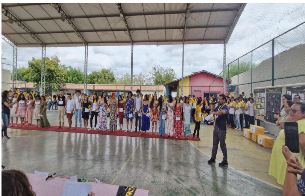
Figura 01 – Desfile da Consciência Negra: momento de integração e valorização da cultura afro-brasileira na escola.

Dentre as ações desenvolvidas, “O Desfile da Consciência Negra” representa o momento de maior engajamento da comunidade escolar, reunindo alunos, professores e gestão em torno da valorização da cultura e da história afro-brasileira. Apesar de sua visibilidade, esta ação integra um conjunto de atividades contínuas que visam promover a reflexão, a aprendizagem e a inclusão, evidenciando que o trabalho pedagógico vai além desse evento central.