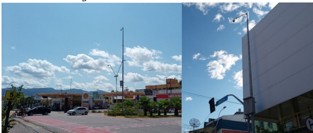
Imagem 03 – Câmeras no centro da cidade de Sobral