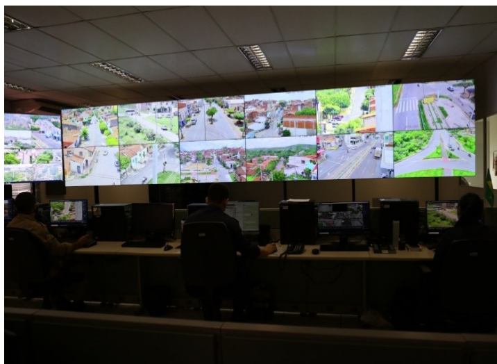
Imagem 01 – Sala de videomonitoramento de Sobral Célula Integrada de Operações de Segurança (CIOPS)