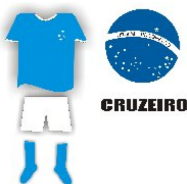
Uniforme do Cruzeiro Escudo inspirado na constelação Cruzeiro do Sul, presente na Bandeira Brasileira Figura. 04

O DIP obrigou os times de São Paulo e Minas Gerais a retirarem o nome “Palestra Itália” e a apresentar novos nomes. Cores e símbolos foram utilizados como formas de representação da resistência de uma identidade cultural. O time do Palestra Itália de São Paulo adotou o nome Sociedade Esportiva Palmeiras. O nome Palmeiras foi justificado como uma alusão às palmeiras imperiais brasileiras. A colônia italiana do Palestra de Minas Gerais, adotou o nome Esporte Clube Cruzeiro, em referência à constelação Cruzeiro do Sul. Mas em seus uniformes, os dois times continuavam a ter referências culturais das cores que representavam a Itália. O time do Palmeiras adotou no distintivo oficial as cores branca, verde e vermelha – cores da bandeira italiana, e o Cruzeiro optou pelo uniforme azul, alusivo à seleção italiana, chamada de esquadra Azzurra . 4