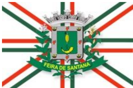
Bandeira de Feira de Santana Figura. 06