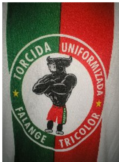
Torcida Uniformizada Falange Tricolor

(15/11/2006 – Final da Copa Nordestinho) Figura. 09