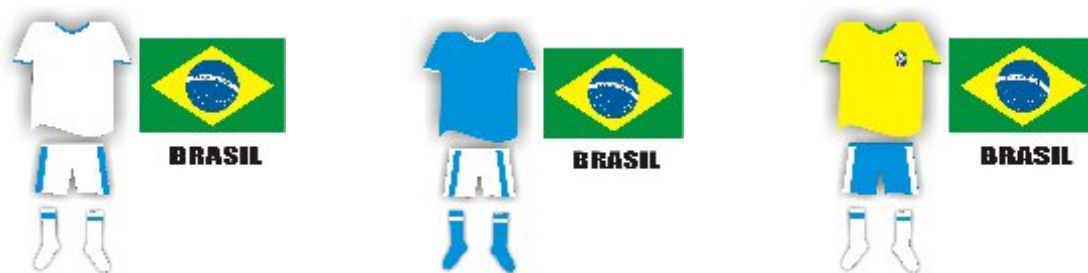
Da esquerda para direita: Camisa branca, usada até 1950. A Camisa azul é até hoje o uniforme oficial n.2. O uniforme principal da seleção brasileira de futebol.