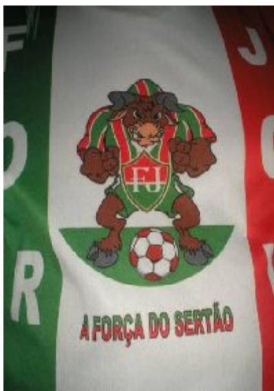
Torcida Força Jovem

(15/11/2006 – Final da Copa Nordestinho) Figura. 09