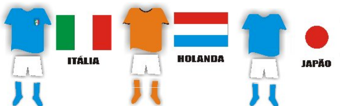
Uniformes e bandeiras (da esquerda para direita): Itália, Holanda e Japão. Figura. 02

O uniforme principal da seleção brasileira de futebol também possui histórias e significados. Até o ano de 1950, era branco, com detalhes azuis. Na Copa do Mundo de 1950, realizada no Brasil, após a derrota na final para o Uruguai, o uniforme branco foi considerado azarado. Os jogadores brasileiros, segundo Nelson Rodrigues, sofriam do “complexo de vira-lata”, pois, segundo ele, não jogaram com garra e amor à camisa e ao país para conquistar o título, até então inédito para o Brasil.