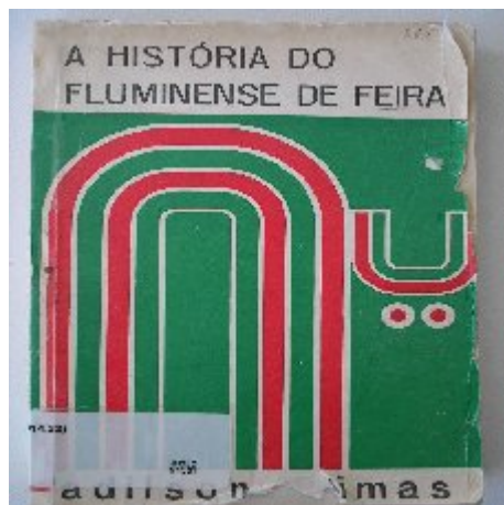
Desenho do touro feito por Juraci Dórea.

Consolidado o nome "Touros do Sertão" na história do futebol baiano, as representações de imagens dos "Touros do Sertão" começam a ganhar forma em 1974, na ilustração feita pelo artista plástico Juraci Dórea para o livro "A história do Fluminense de Feira" (1974), do jornalista Adilson Simas.