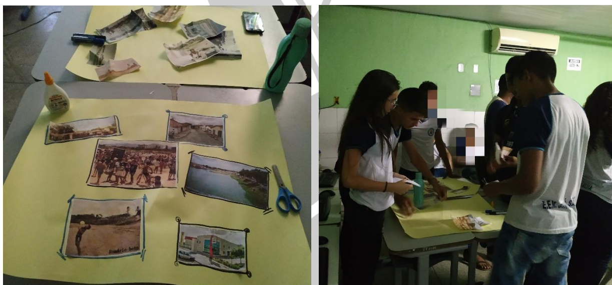
Figura 2- Montagem da exposição de fotografias.

A terceira etapa ocorreu após a apresentação das ilustrações e foi destinada a exposição das fotografias e aplicação de um questionário. A mostra foi montada pelos alunos através de ilustrações antigas e recentes do bairro. Eles as dispuseram de forma progressiva e foram apontando as transformações, mencionando tanto o que havia sido aprendido tanto seus conhecimentos cotidianos sobre a área (ver figura 2).