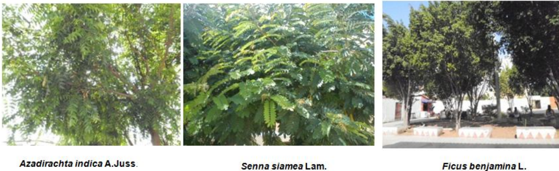
Figura 2 – Espécies mais abundantes nas áreas de estudo: Azadirachta indica A. Juss (Nim), Senna siamea (Lam.) H.S.Irwin & Barneby (Acácia) e Ficus benjamina . Sobral, Ceará, 2011.

Dentre as espécies catalogadas, as mais abundantes foram Azadirachta indica A. Juss (Nim) com 36,2 % das espécies, Senna siamea (Lam.) H.S.Irwin & Barneby (Acácia) com 11,2% e Ficus benjamina L. (Ficus) com 9,63% (Figuras 2 e 3, Tabela 1). Apenas, a última espécie citada é nativa, endêmica do Brasil e com distribuição geográfica no Nordeste do país.