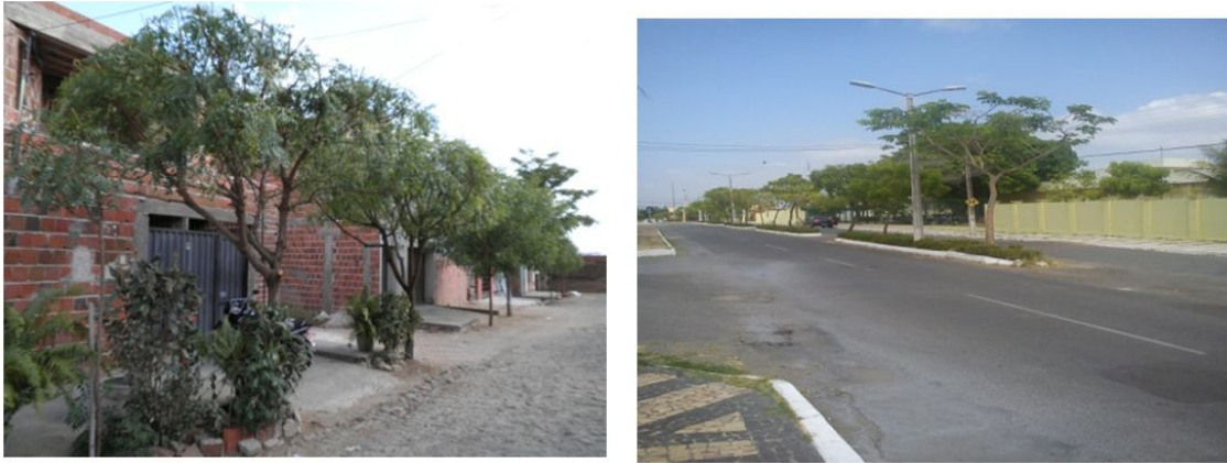
Figura 4 – Indivíduos de Azadirachta indica A. Juss (Nim) e Albizia lebbbeck L. (Plumosa) encontradas nas vias públicas dos Bairro Betânia e Derby em Sobral, Ceará. 2011.

Conforme Silva (2000), a baixa diversidade específica é comum na maior parte da arborização urbana, mesmo não sendo uma situação desejável. Da mesma forma, alguns autores verificaram uma maior concentração de indivíduos distribuídos num pequeno número de espécies, em levantamentos florísticos em Maringá, PR (MILANO, 1988), Vitória, ES (ESPÍRITO SANTO, 1992), Piracicaba, SP (LIMA et al., 1994) e Porto Alegre, RS (PORTO ALEGRE, 2000).